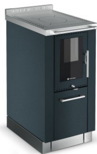
PANORAMA Anthracite F9 Armatures Anthracite F9 (optional)