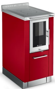
PANORAMA Rouge F6