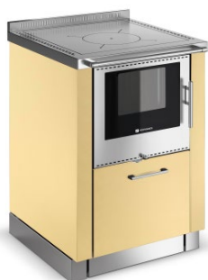
PANORAMA Ivoire F4