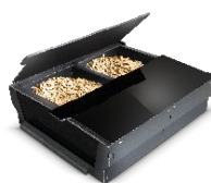
PELLET BOX (optional)