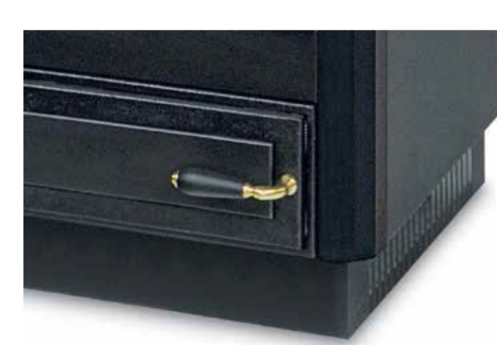
PLINTHE PEINTE OU INOX